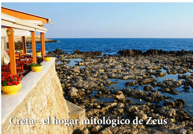
Creta - el hogar mitológico de Zeus

Hoy: nuestra primera parada de hoy es Creta, la mayor de las islas griegas, la cuna de la gran civilización minoica y el hogar mitológico de Zeus. A