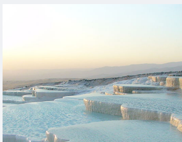
las piscinas termales de Pamukkale