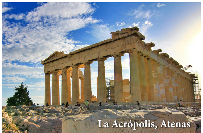
La Acrópolis, Atenas

Hoy: Nos trasladaremos al aeropuerto esta mañana para abordar nuestro vuelo de regreso a casa.