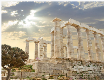
El Templo de Zeus