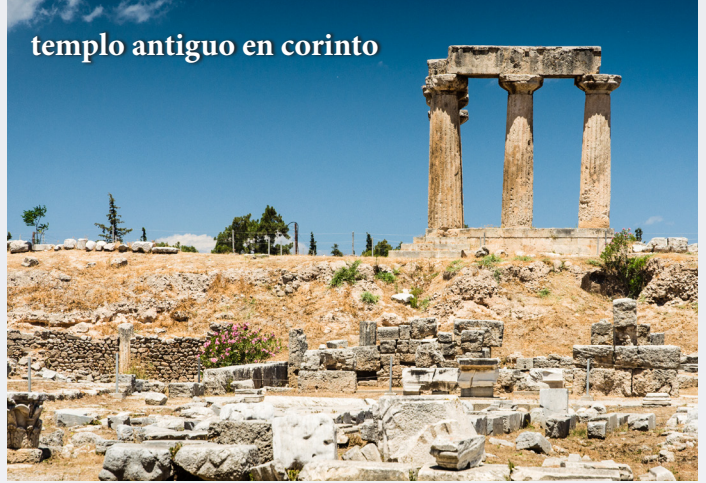
templo antiguo en corinto

continuación, pasaremos por el pueblo de Heraklion hasta las excavaciones de Cnosos, donde ha habido vestigios de civilización desde el 4000 a.C. Luego, regresaremos a Heraklion, donde tendrá tiempo libre para hacer lo que desee. A la hora indicada, regresamos al barco para continuar nuestro crucero hacia Santorini, la más hermosa de las islas. Dado que Santorini se eleva sobre la superficie del mar, subiremos en telesilla para explorar esta increíble isla paradisíaca.